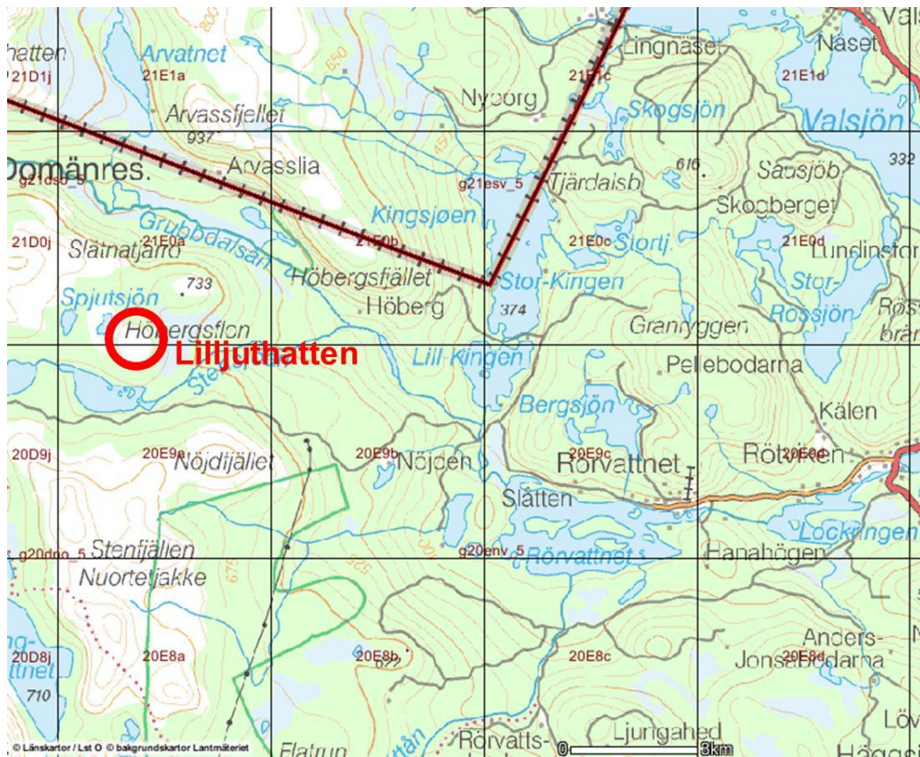
Figur 2. Översiktskarta med Lilljuthattens läge. Underlagskarta från Sveriges länskartor.

Lilljuthatten ligger i norra delen av Krokoms kommun, nära gränsen till Norge, cirka 13 km västnordväst om byn Rörvattnet, se översiktskartan i Figur 2 . Söder om Lilljuthatten finns en grusväg från Rörvattnet till samevistet Stora Stensjön. En mindre arbetsväg går upp på Lilljuthatten sedan provborringarna kring 1980.