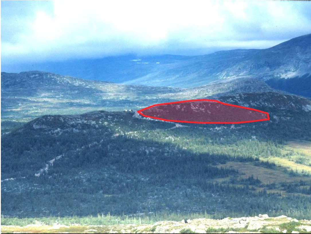
Figur 4. Dagbrottets ungefärliga omfattning markerad på ett foto av Lilljuthatten 1981

Med utgångspunkt från rapportens svårtolkade kartor har dagbrottets utsträckning ritats över på Lantmäteriverkets detaljkarta över området, se Figur 3 . I Figur 4 har dagbrottets ungefärliga läge markerats på ett foto av Lilljuthatten taget från sydöst.